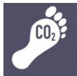
CO 2 Fußabdruck